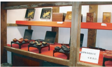
松城邸は基本的に第一・第三日曜日の午前中、無料で一般公開しています。