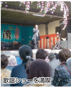
歌謡ショーを満喫